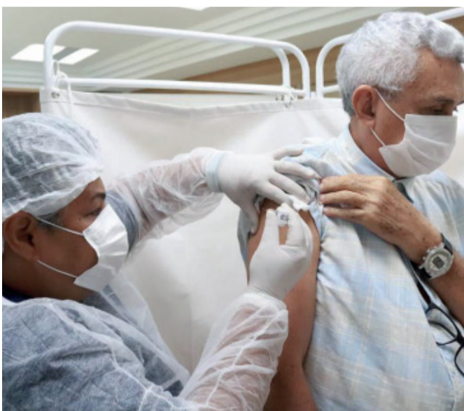
Esquema vacinal ocorreu durante 5 dias

Campanha foi realizada com adesão do Sindifisco e teve público-alvo estendido