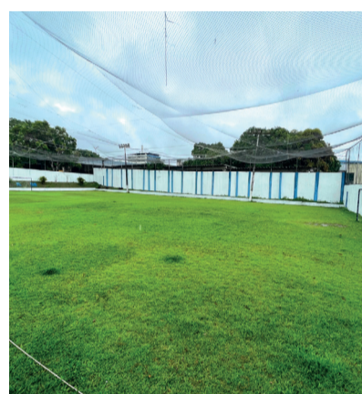
CAMPO DE FUTEBOL