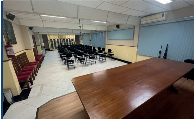
ESPAÇO PARA 100 PESSOAS