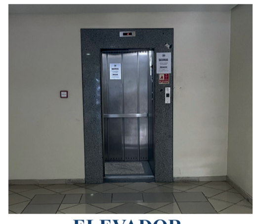
ELEVADOR COM ENTRADA INDEPENDENTE