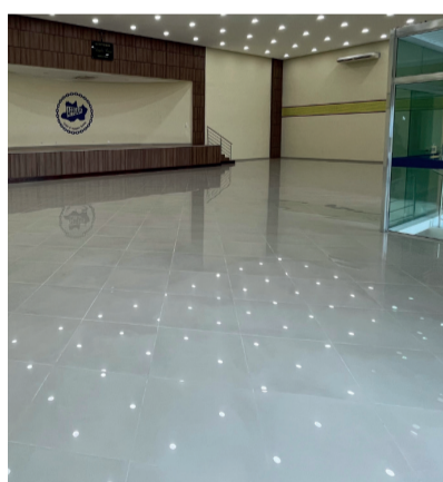
ESPAÇO PARA 400 CADEIRAS