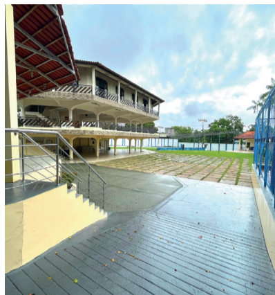
ESPAÇO PARA 400 PESSOAS