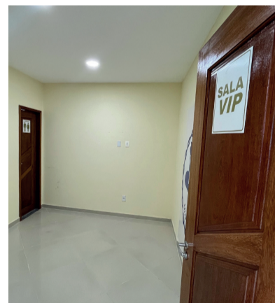
SALA VIP COM BANHEIRO