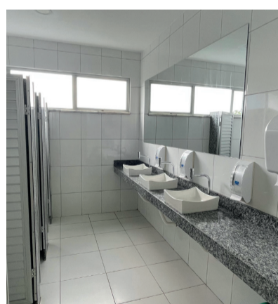
BANHEIRO FEMININO E MASCULINO