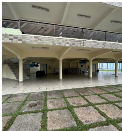
ÁREA COBERTA E DESCOBERTA