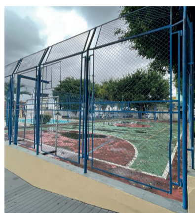
QUADRA DE BASQUETE