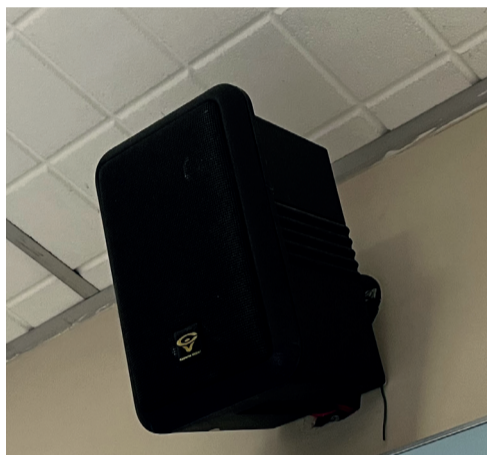
SISTEMA DE SOM