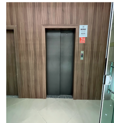
ELEVADOR COM ENTRADA INDEPENDENTE