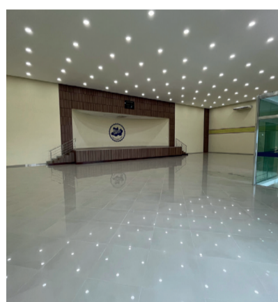
ESPAÇO PARA 25 MESAS DE 10 PESSOAS