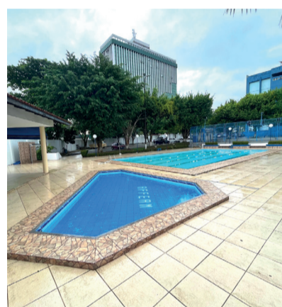
PISCINA ADULTO E INFANTIL