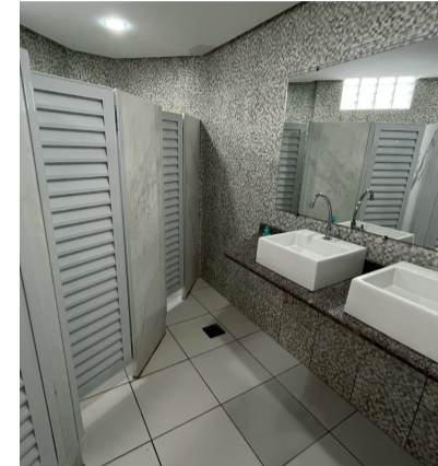
BANHEIRO FEMININO E MASCULINO